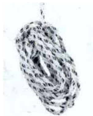
FUNE DA 12 30 mt. Cod. 1350250

CORDINO, FUNE 12 mm, GANCIO DA PONTEGGIO, 2 m