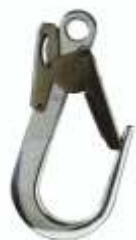
MOSCHETTONE 1008351 Cod. 1850045