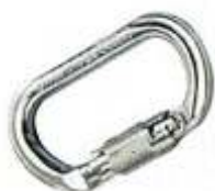
MOSCHETTONE 1004327 1850155