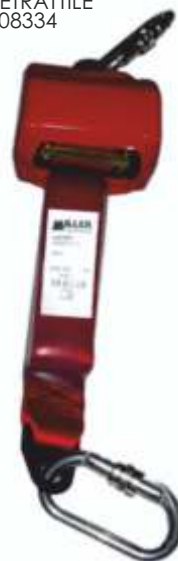
DISPOSITIVO RETRATTILE C/MOSCH. 1008334 Cod. 1350220

Dispositivo retrattile con gancio a doppia leva e connettore per impalcatura. Compatto e leggero, offre una maggiore sicurezza rispetto ai cordini di trattenuta tradizionali, in quanto dotato di un sistema di bloccaggio che limita la caduta libera in pochi centimetri. Capacità di lavoro massima di 2,80m. E' dotato di indicatore di caduta, parti interne resistenti alla corrosione, una struttura in acciaio inossidabile/alluminio e un carter di protezione ad elevata resistenza. Il dispositivo può essere utilizzato per varie applicazioni.