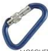
MOSCHETTONE 1002833 Cod. 1850145