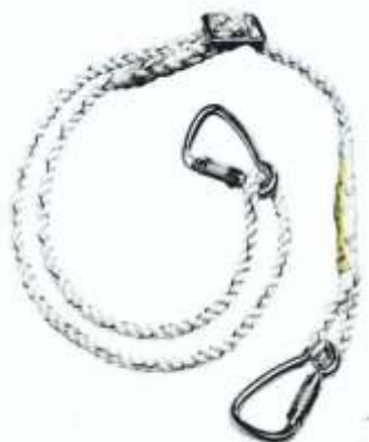
CORDINO POS. MT.1,80 1008288 Cod. 1350040

Cordino di posizionamento sul lavoro Titan sono ideali per una gamma completa di applicazioni, tra cui l'edilizia e la manutenzione generale.