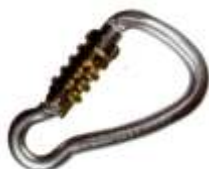
MOSCHETTONE 1002834 Cod. 1850052