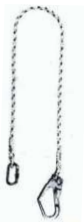
CORDINOC/MOSCH. 1004576 Cod. 1350230

CORDINO, FUNE 12 mm, GANCIO DA PONTEGGIO, 2 m