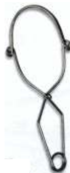
PINZA DA 140mm 1002831 Cod. 1950060