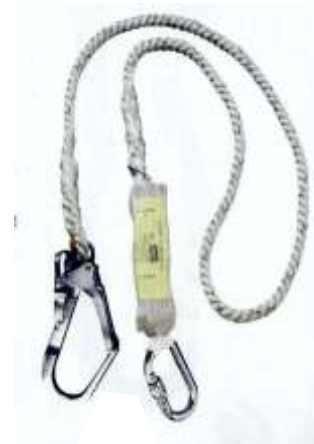
CORDINO C/ASS. MT. 2 1008281 Cod. 1950037

Cordini con assorbitore di energia Miller per spigolo vivo (EUR) Questo prodotto ha superato il test su "spigolo vivo" e garantisce la protezione dell'utilizzatore nei lavori in altezza e vicino agli spigoli. Incorporano un assorbitore di energia che garantisce che la forza di impatto dell'utilizzatore non superi mai 6 kN.