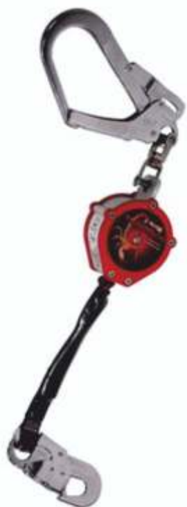
DISPOSITIVO RETRATTILE SCORPION 1008588 Cod. 1350210