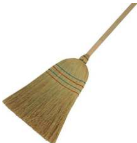
SCOPA SAGGINA Cod. 2850470