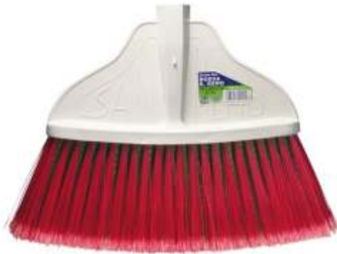
SCOPA SAN REMO Cod. 2850425