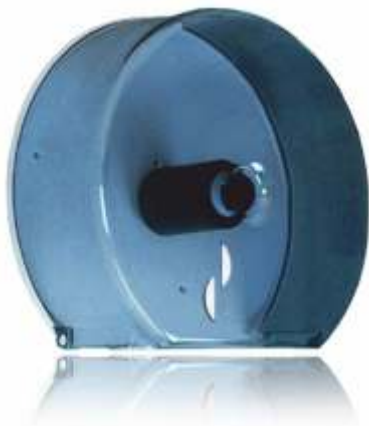
PORTA ROTOLI CARTA IGIENICA MAXI JUMBO Cod. 2850110 MINI JUMBO Cod. 2850115