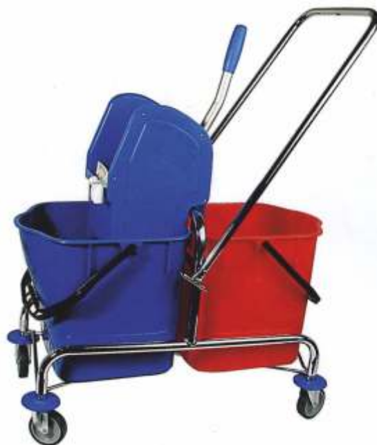
CARRELLO LAVAPAVIMENTII JAK Cod. 2850740