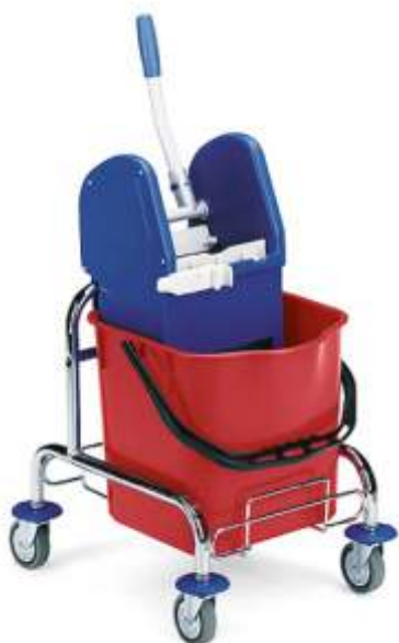
CARRELLO LAVAPAVIMENTI MINI JAK Cod. 2850750