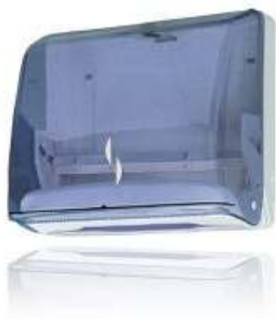
SUPPORTO MINI CARTA Cod. 2850105