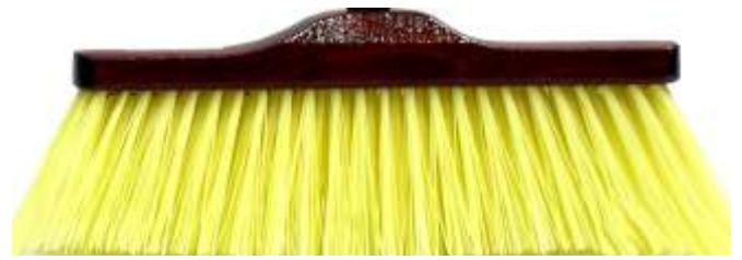
SCOPA MOQUETTES Cod. 2850455