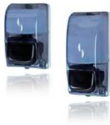
DOSATORI SAPONE LIQUIDO MINI ART. 513 Cod. 2850135 Maxi ART. 515 Cod. 2850130