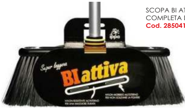
SCOPA BI ATTIVA COMPLETA DI MANICO Cod. 2850410