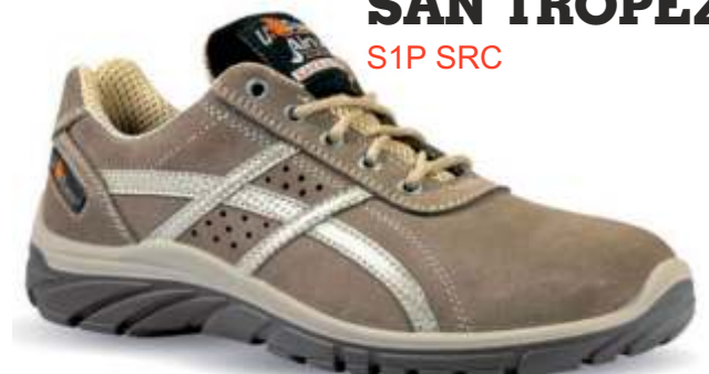
SAN TROPEZ S1P SRC