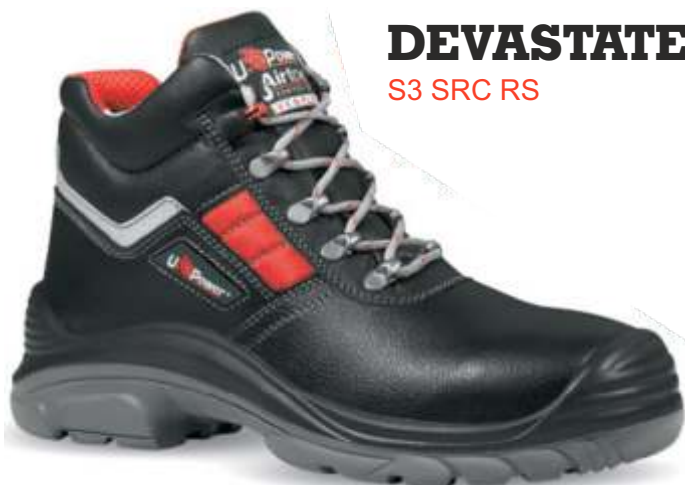
DEVASTATE S3 SRC RS