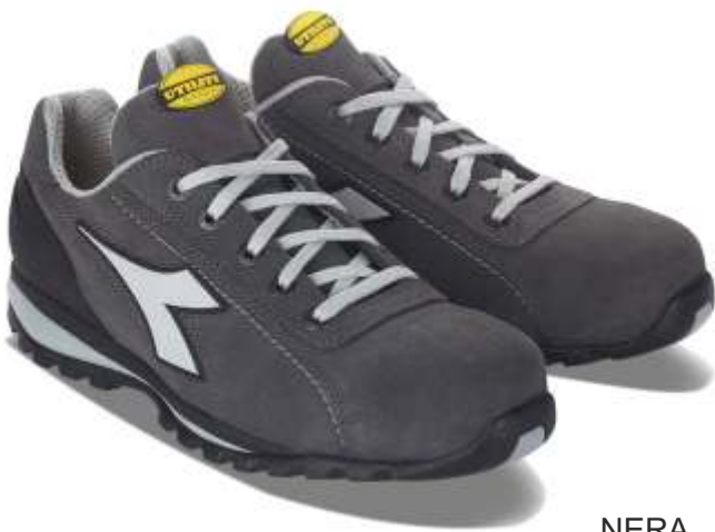
NERA ROCCIA LUNARE