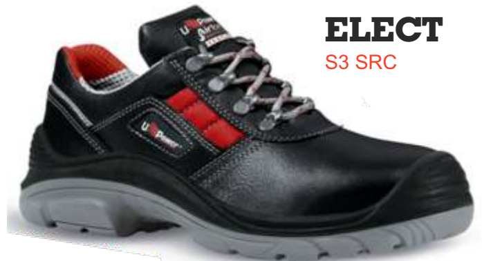
ELECT S3 SRC